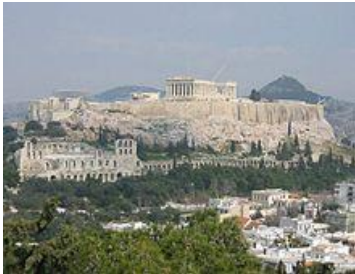
Obr. 2: Dominantou Athén je Akropolis a dominantou Akropole Parthenon