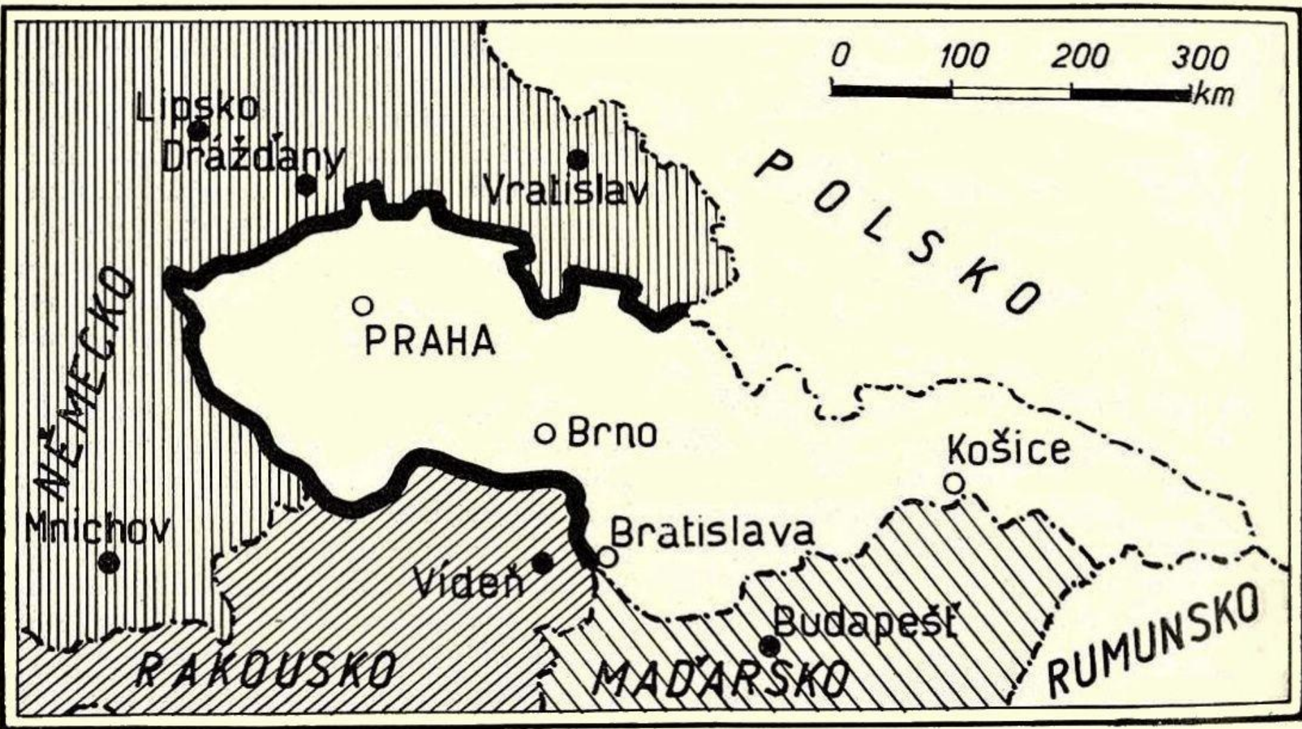
Jak by naše republika po „Anschlusu“ byla obklopena německým územím a téměř uzavřena, kdyby tyto hranice byly prodlouženy maďarskými.