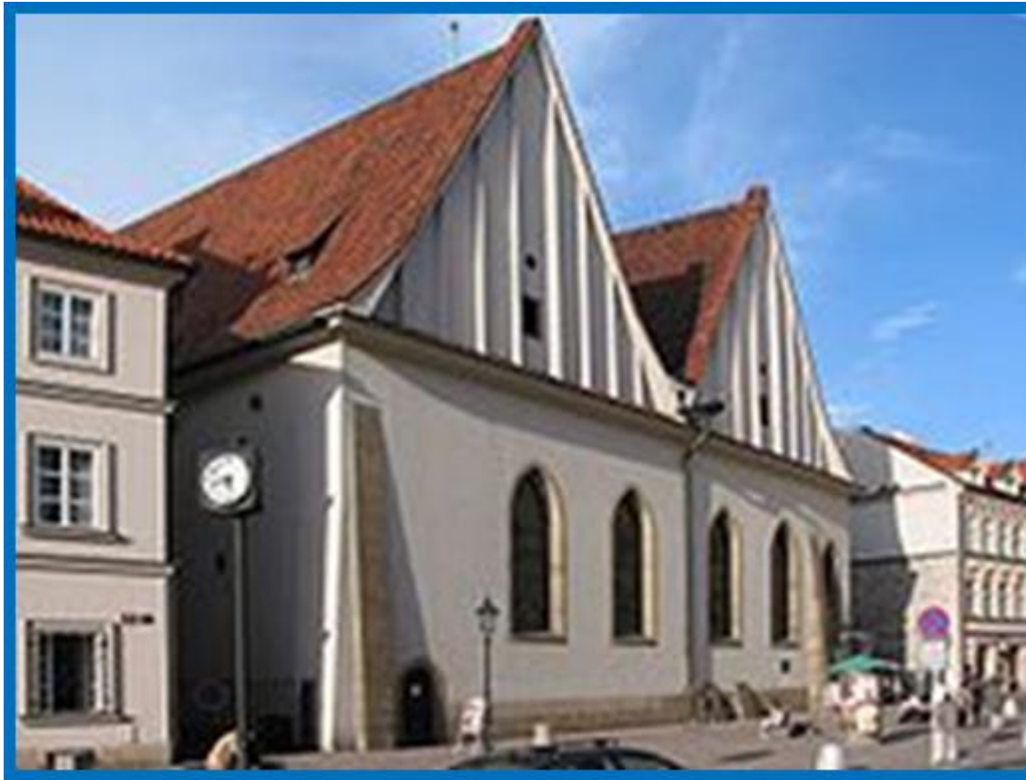
Betlémská kaple v současné době

Ve svých kázáních kritizoval mravní problémy římsko-katolické církve a odpustky.