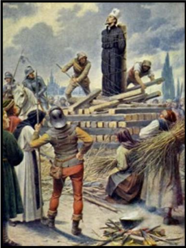
Upálení Jana Husa

Jan Hus neustoupil ze svých názorů a byl 6. července 1415 upálen na hranici před hradbami Kostnice . Husův popel byl vysypán do Rýna, aby z něj nic nezůstalo jeho věrným.