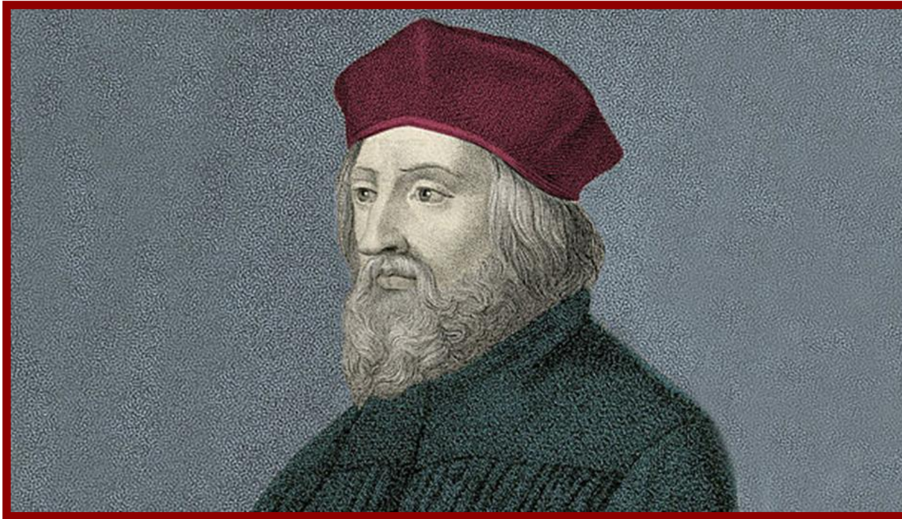
Mistr Jan Hus

Mistr Jan Hus byl významný kazatel , jehož učení dalo vzniknout husitskému hnutí a započalo reformu tehdejší církve. 6. července 1415 byl upálen v Kostnici. Toto datum je českým státním svátkem.