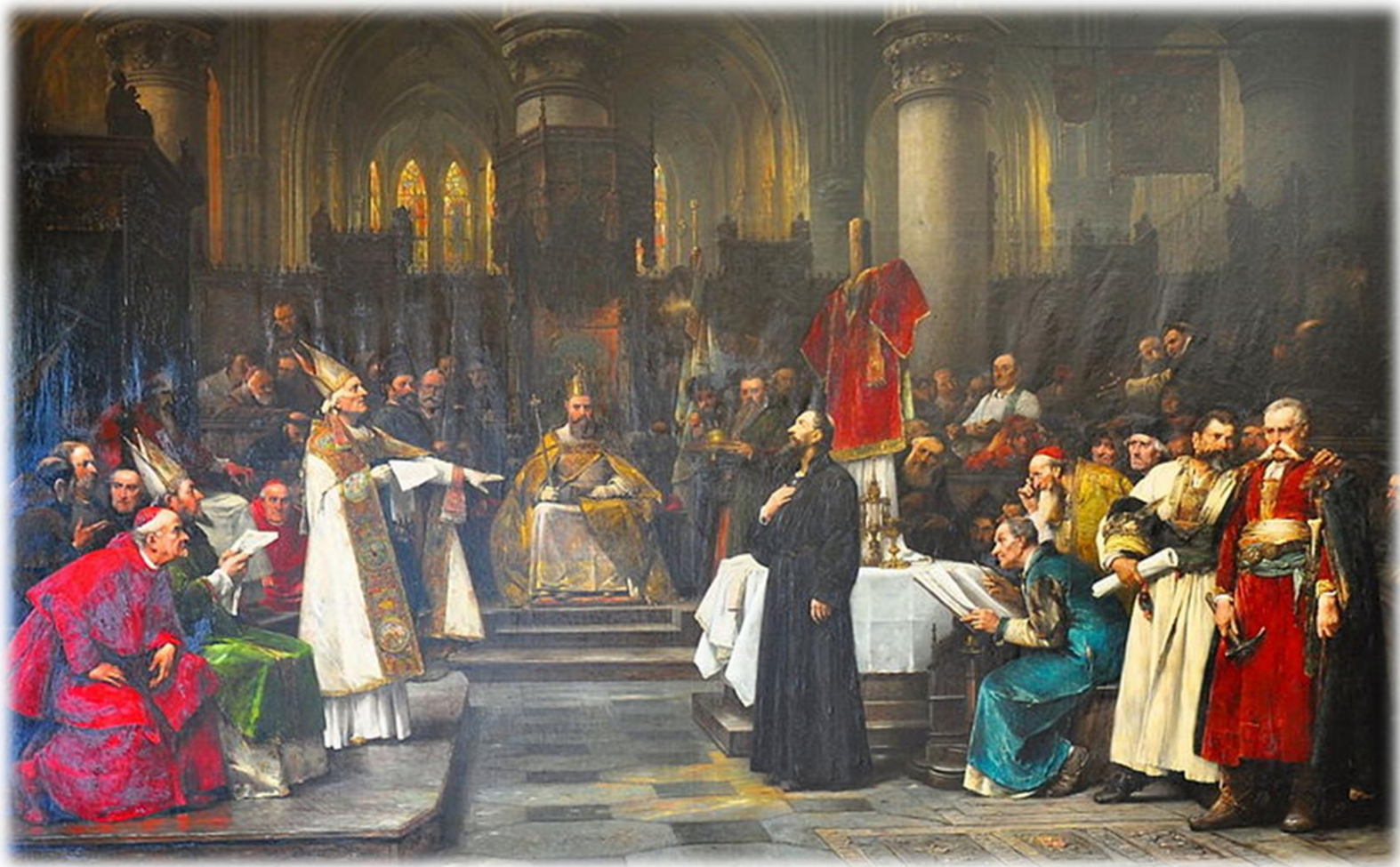
Mistr Jan Hus před Kostnickým koncilem.

Papež na Husa vyhlásil klatbu a nařídil jeho zjetí. Byl souzen v Kostnici .