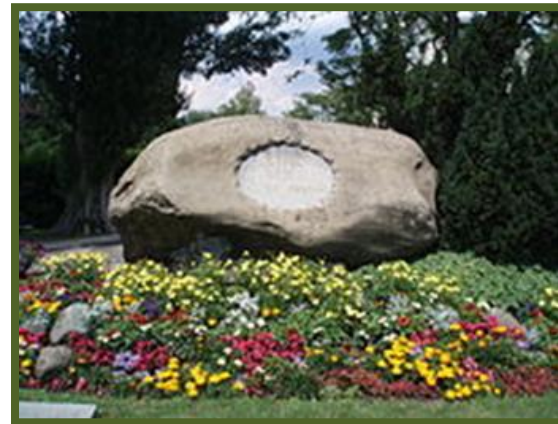
Památník z roku 1862 na místě Husova upálení