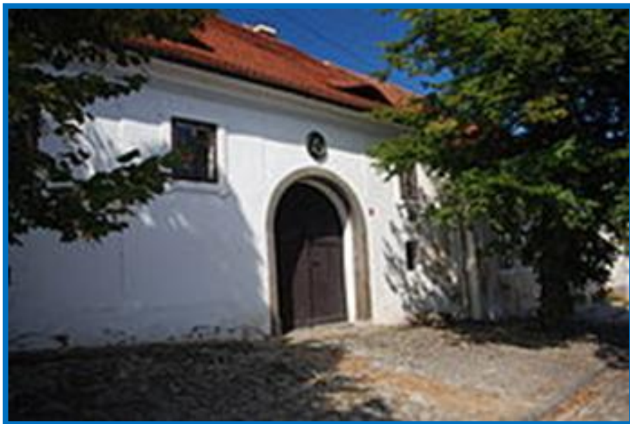
Rodný dům Mistra Jana Husa

Hus se narodil v Husinci .Studoval na pražské univerzitě. Později se stal i jejím rektorem.