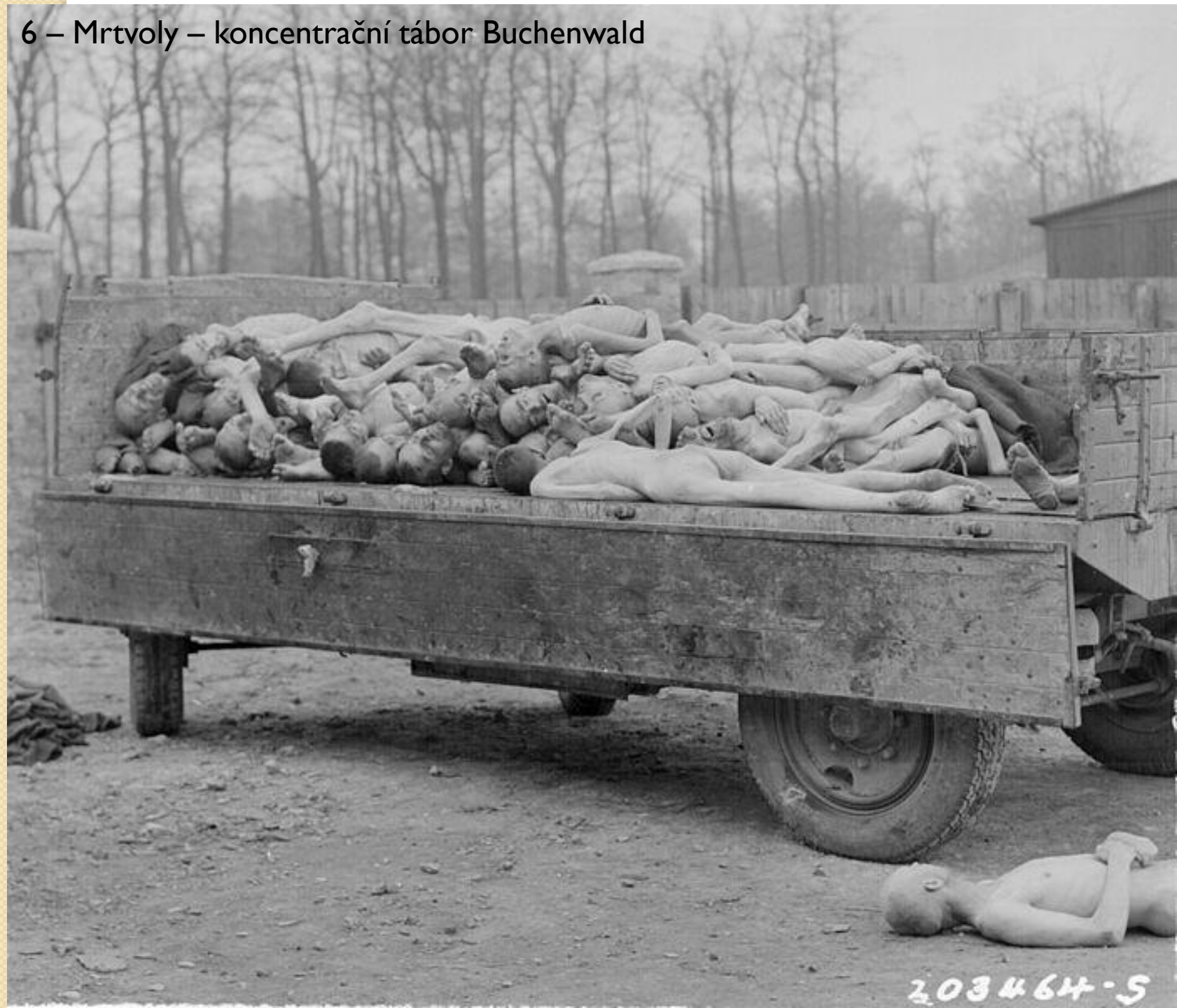
6 – Mrtvoly – koncentrační tábor Buchenwald