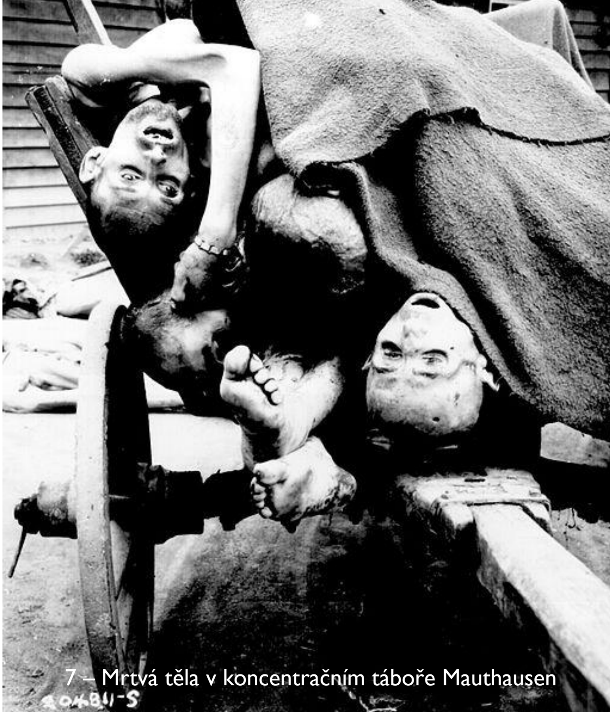
7 – Mrtvá těla v koncentračním táboře Mauthausen