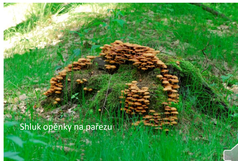
Shluk opěnky na pařezu