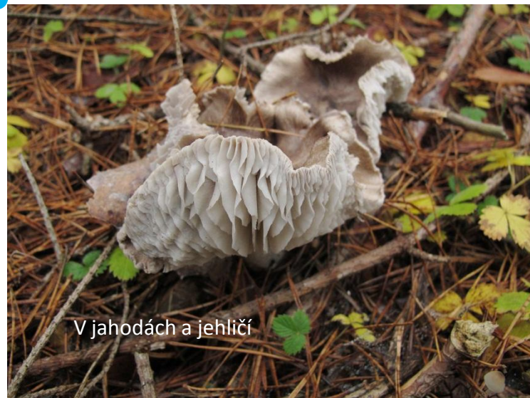
V jahodách a jehličí