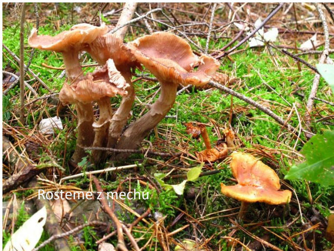
Rosteme z mechu