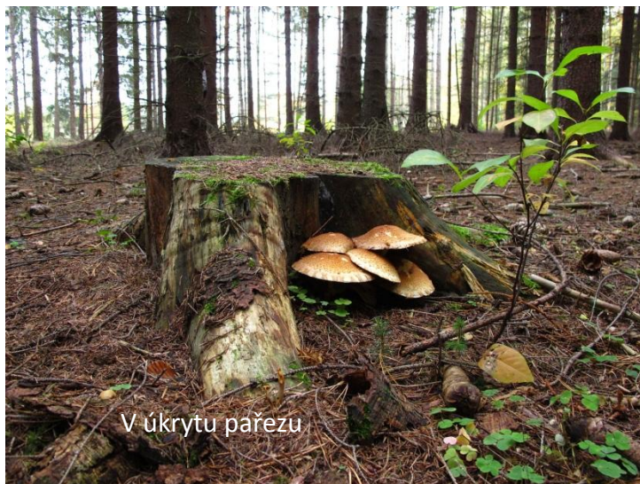
V úkrytu pařezu