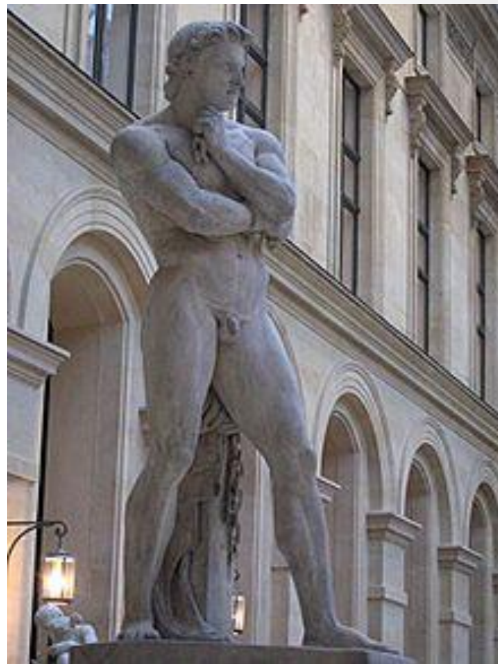
Obr. 3: Socha Spartaka

gladiátoři - otroci cvičení k boji v aréně, Spartakus byl utečenec z římského vojska, meč a štít, síť a trojzubec, kopí apod.