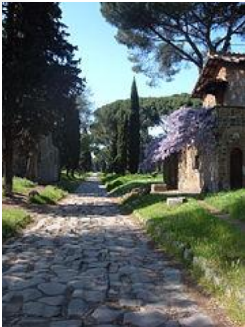
Obr. 2: Via Appia ( Appiova cesta )