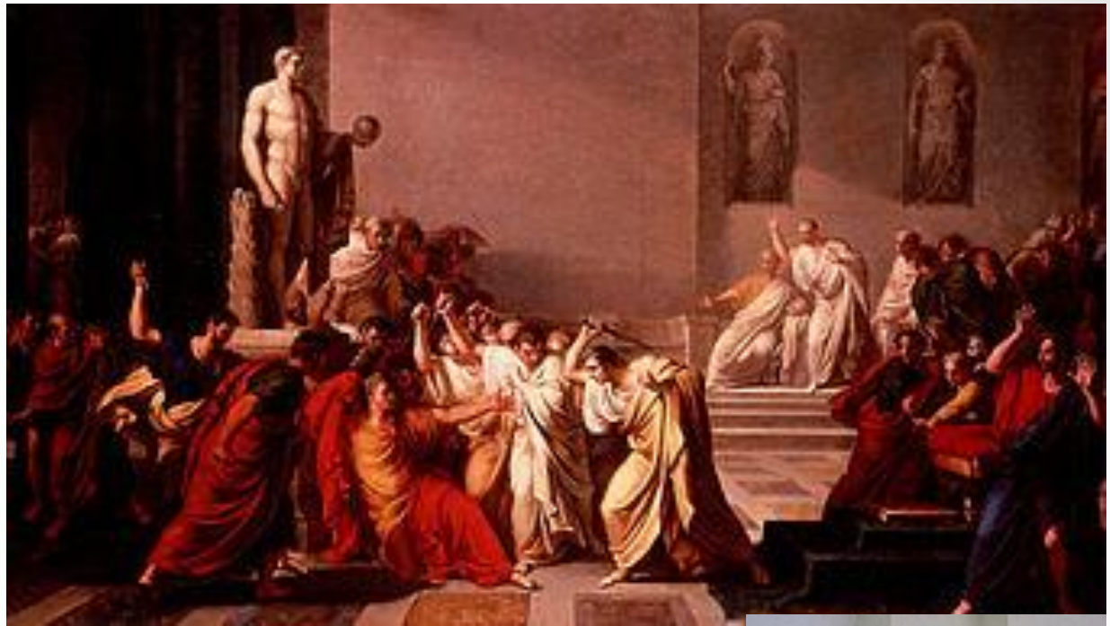
Obr. 2: Smrt Caesara od Vincenza Camucciniho