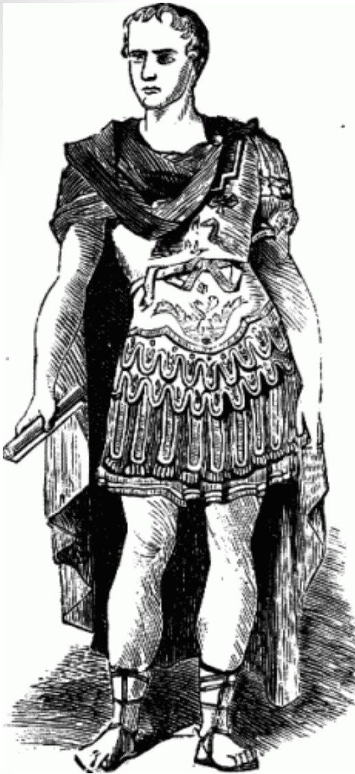
Obr. 1: Kresba Julia Caesara