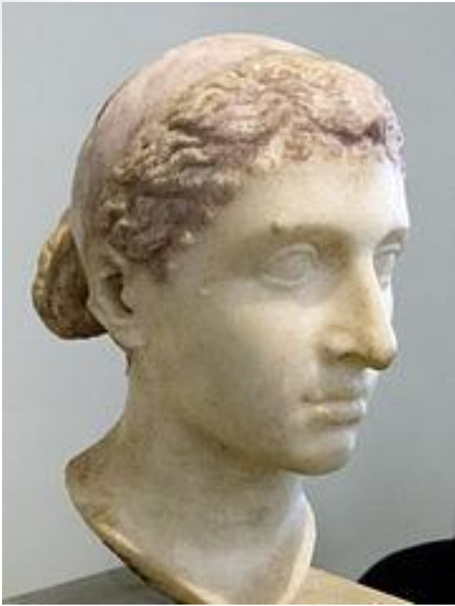
Obr. 3: Kleopatra