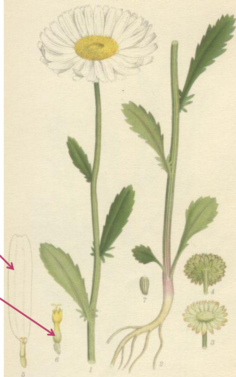
7 - kopretina