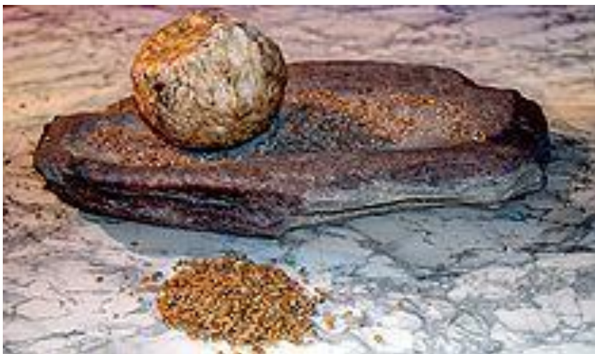
Obr. 5: Primitivní nástroj na mletí obilí.