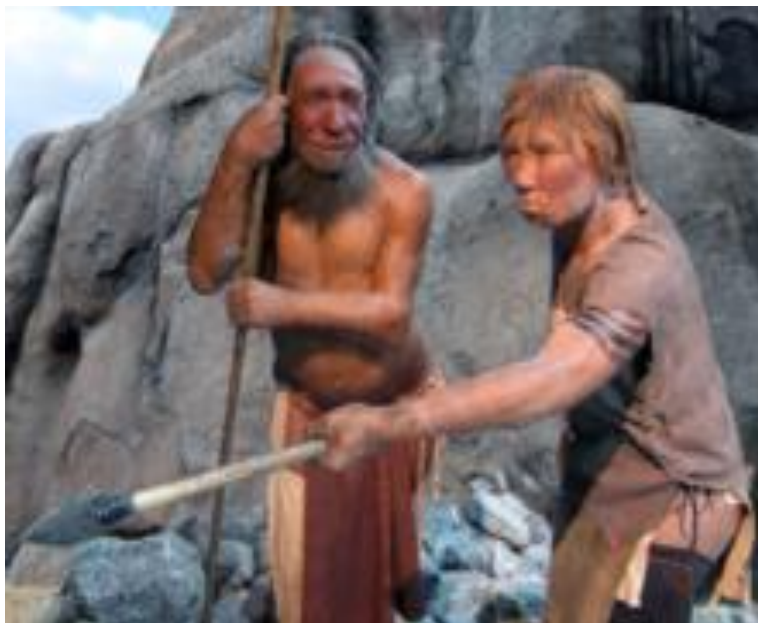
Obr. 3: Hmotová rekonstrukce vzhledu neandrtálců