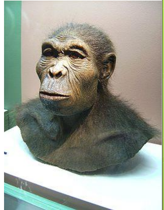
obr.1: Rekonstrukce podoby člověka zručného