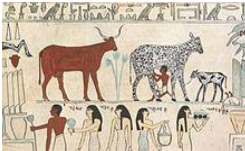
Obr. 6: Domestikovaný skot byl využíván k produkci mléka.