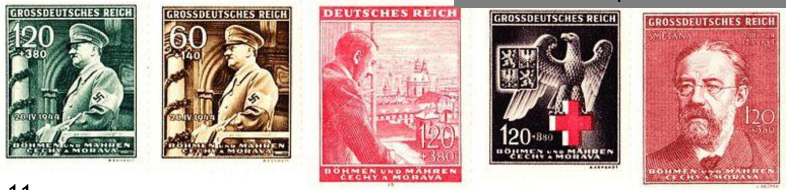
Protektorátní poštovní známky