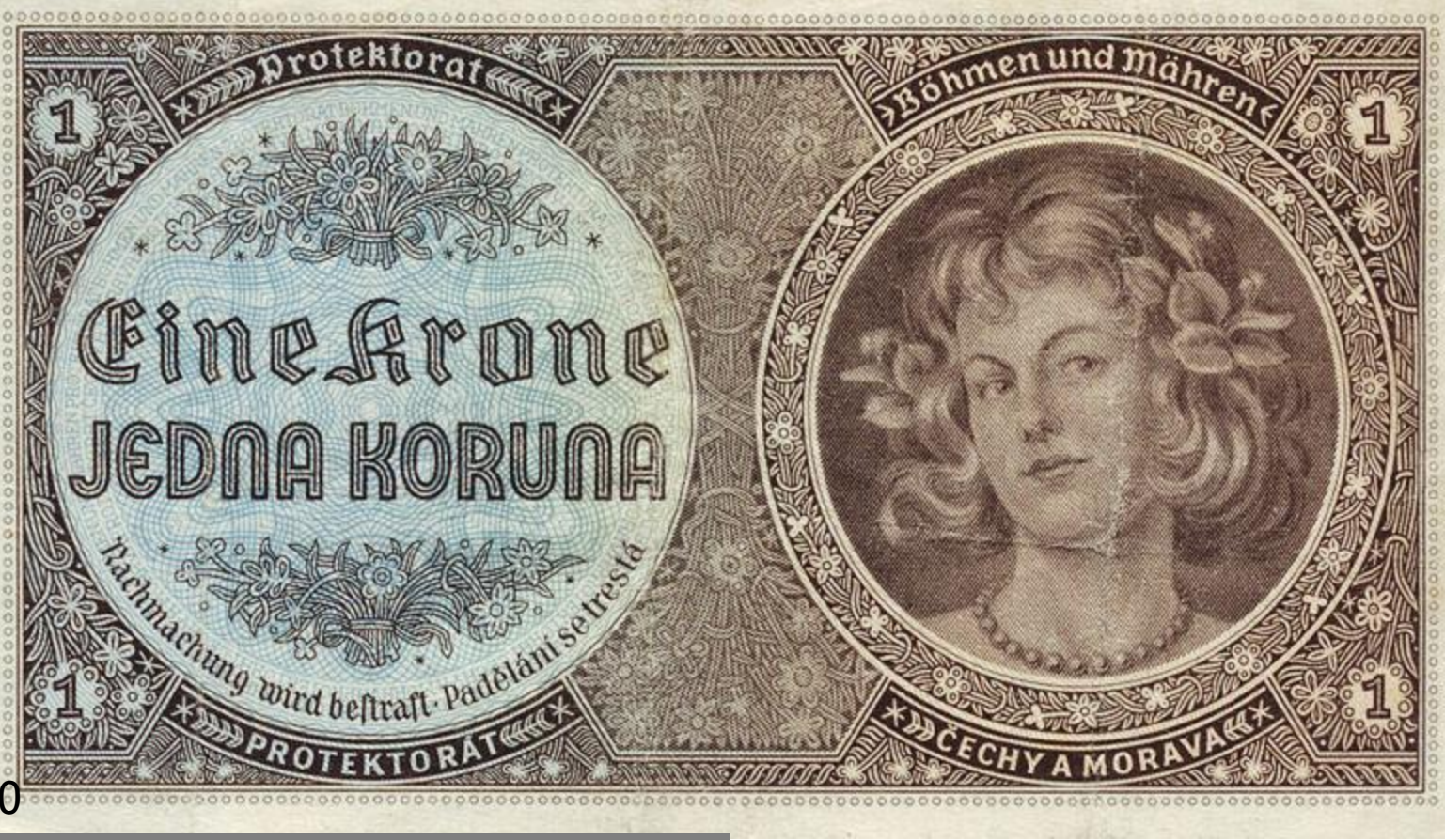
10 Protektorátní koruna - lícová strana