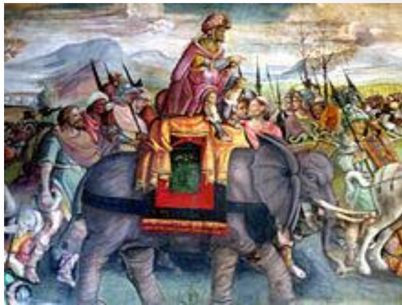
Obr. 2: Freska Hannibala na válečném slonovi při přechodu Alp, Kapitolské muzeum, Řím