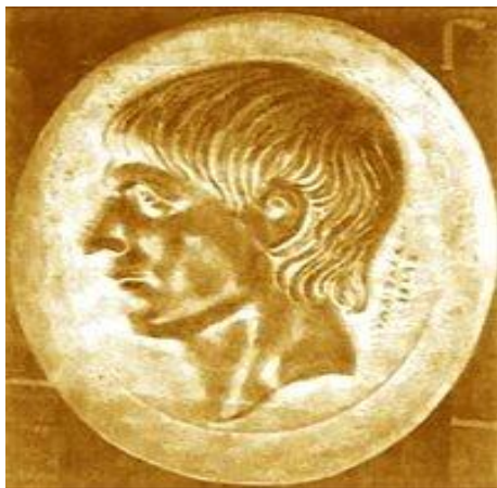
Obr. 6: Scipio Africanus