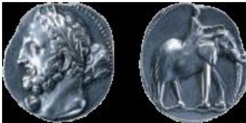
Obr. 3: Hannibal vyobrazený na stříbrném šekelu