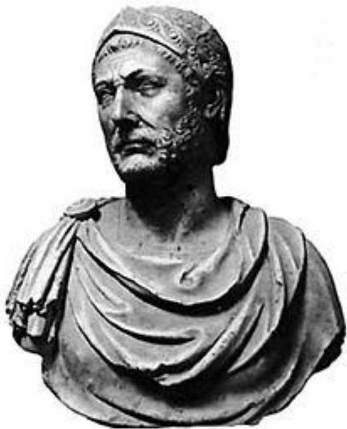
Obr. 1: Hannibalova mramorová busta z Capui, patrně vyhotovená za jeho života