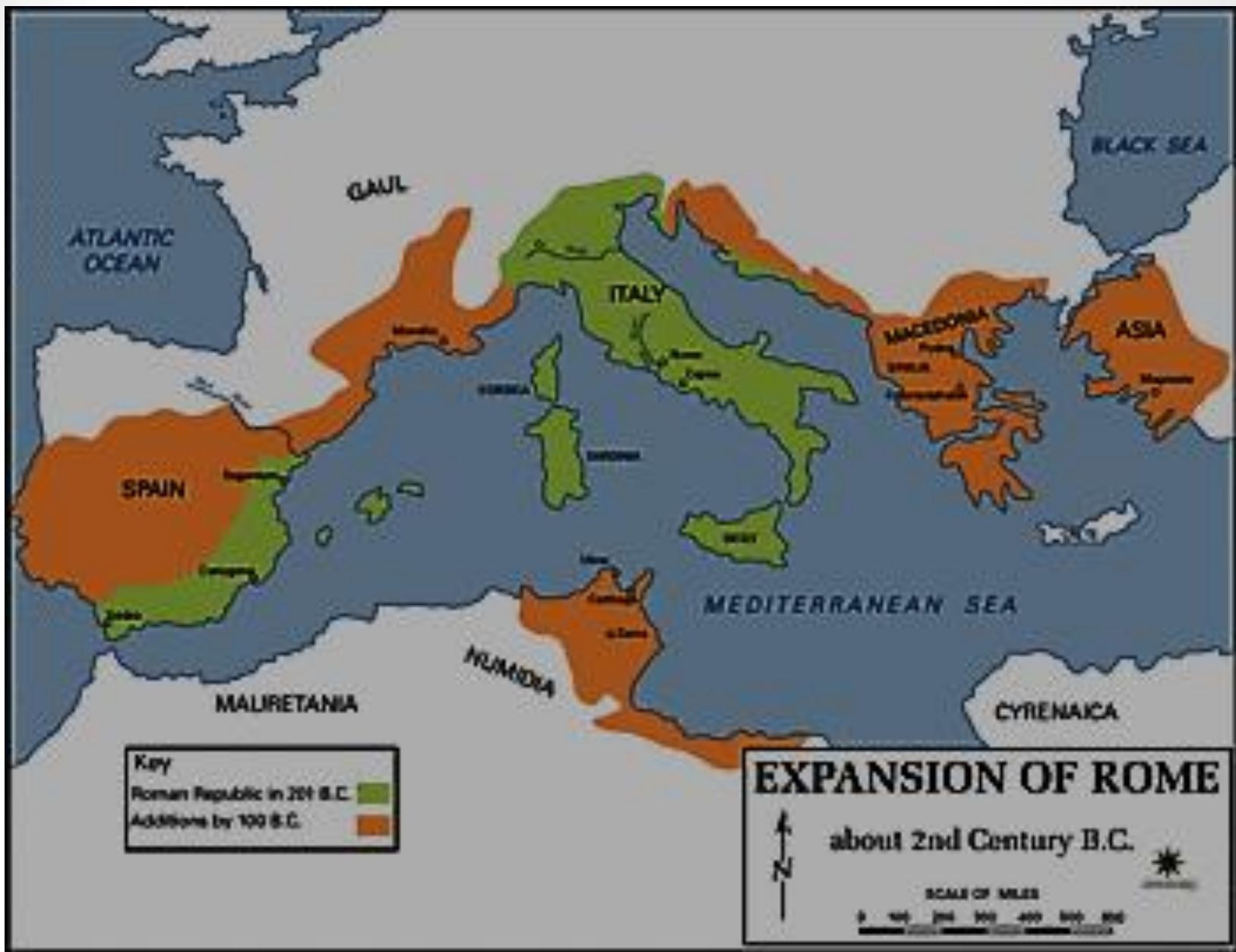
Obr. 7: Expanze římské republiky ve 2. století př. n. l.