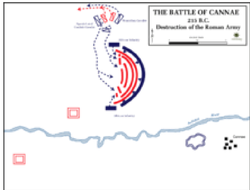
Obr. 5: Obklíčení římského vojska v bitvě u Kann