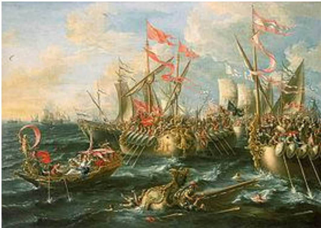
Obr. 2: Bitva u Actia , obraz od Lorenza Castra