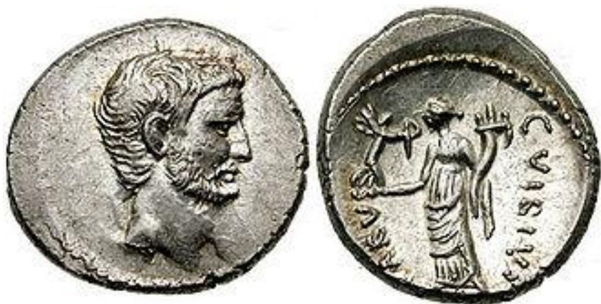
Obr. 3: Mince s portrétem Marca Antonia