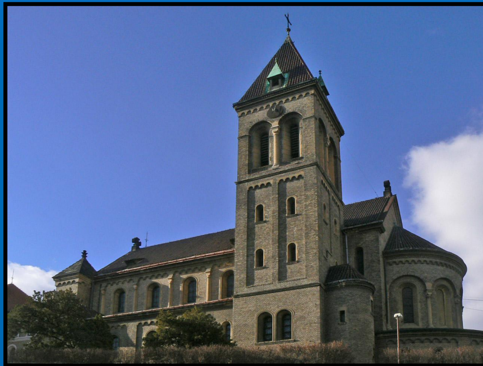
Kostel svatého Gabriela (Smíchov)