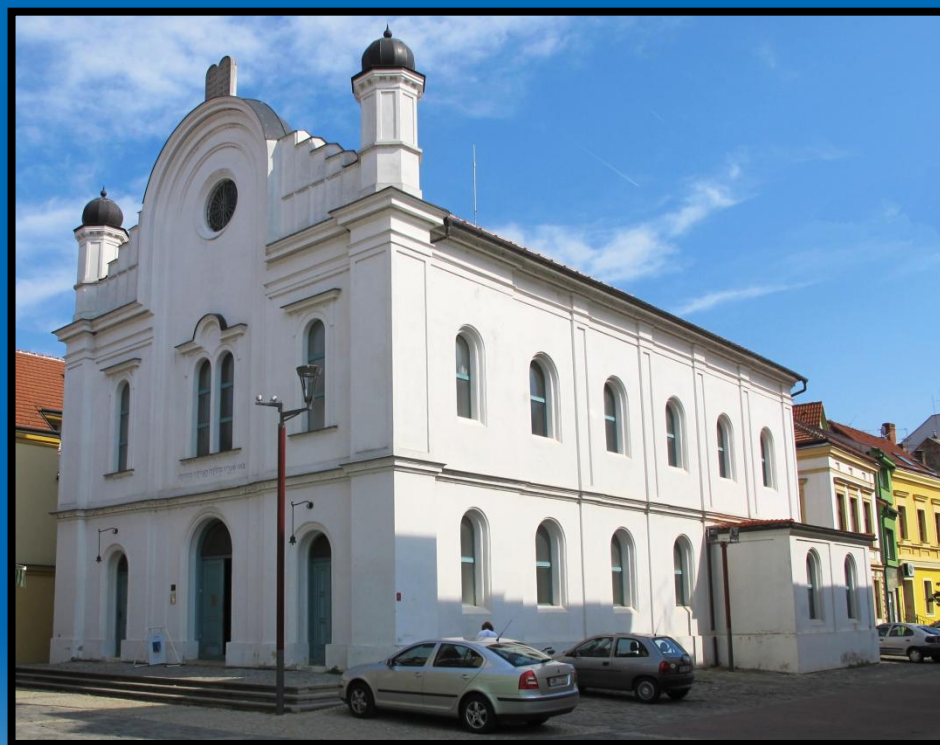
Synagoga v Českém Krumlově