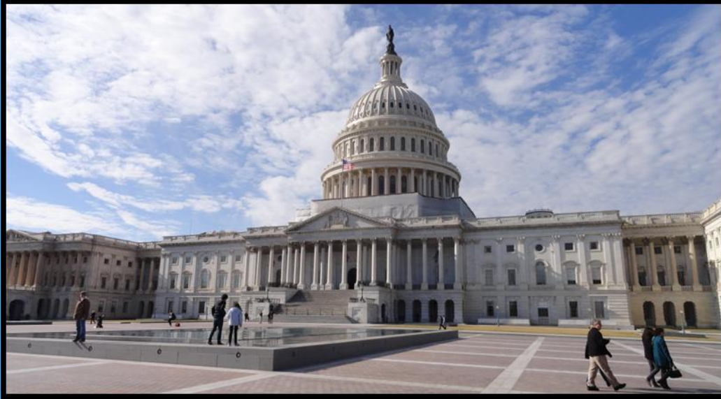
Capitol - Washington, DC