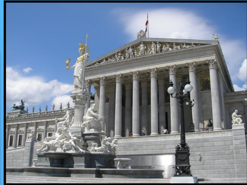
Parlament ve Vídni