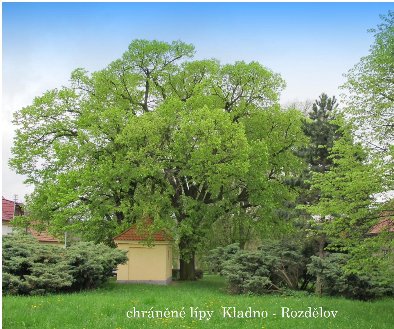
chráněné lípy Kladno - Rozdělov