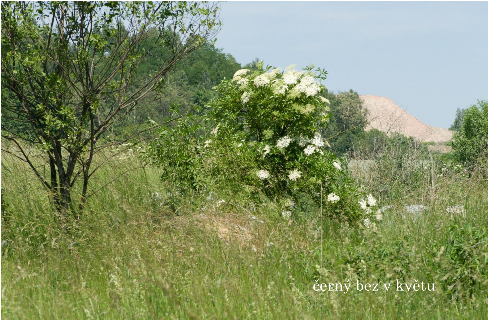
černý bez v květu