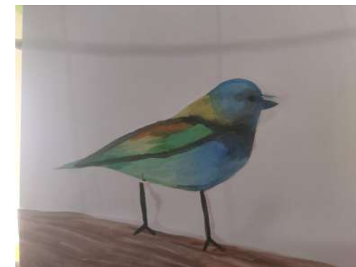
Žáci 9. tříd