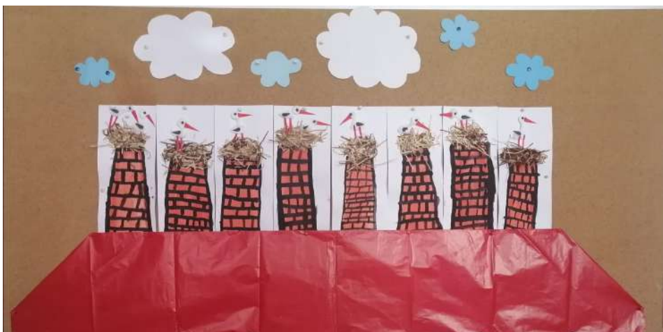
Žáci 1. A

Místo činu Byla spáchána vražda. Proč a kdo to má na svědomí, se pokusili zjistit účastníci workshopu „Místo činu“. Nejdříve se rozdělili do skupin a následně zahájili vyšetřování. Prohlédli veškeré předměty a udělali tip co by mohlo posloužit jako vražedná zbraň, vyslechli rodinu i souseda se kterým oběť nebyla v moc dobrých vztazích, zkoukli záznamy z kamer, pracovali s výsledky z patologie a zkoumali otisky prstů, které odhalili pravdu o skutečném vrahovi. První tři úspěšné skupiny byly odměněny. Všem bez ohledu na to zda dostali-li cenu, zůstali krásné zážitky.